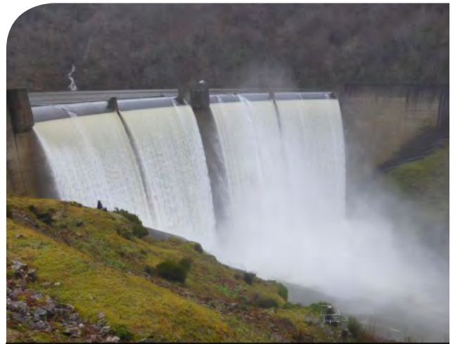
Déversement au barrage d'Hautefage