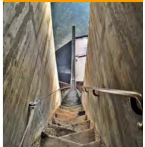
Escalier le long des évacuateurs de crue du barrage de l'Aigle